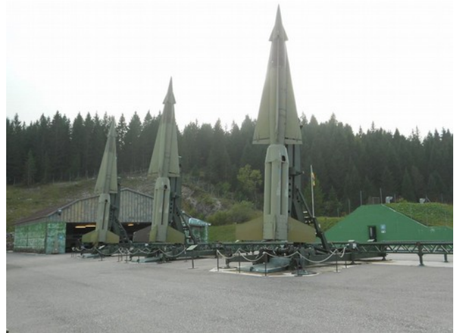
I missili Nike Hercules presenti nel piazzale della ex Base NATO "Tuono" a Passo Coe