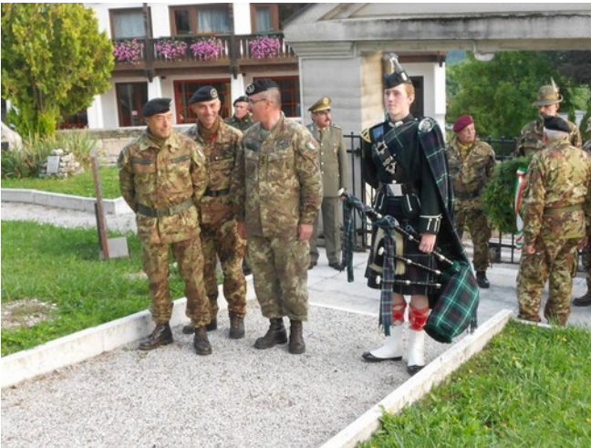
Preparazione della cerimonia di resa degli onori ai caduti a Folgaria

In tarda serata di sabato si è quindi tenuta una cerimonia di resa degli onori ai caduti presso il Cimitero militare di Folgaria, dove sono sepolti i caduti del 59° reggimento "Rainer" dell'esercito austro-ungarico. Quindi in serata cena di coesione presso la colonia di Serrada.