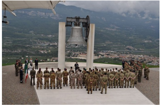
Lo schieramento dei concorrenti e dell'organizzazione alla Campana dei Caduti di Rovereto

che è riuscita a chiudere il percorso con ben due ore di anticipo rispetto a tutti gli altri concorrenti.